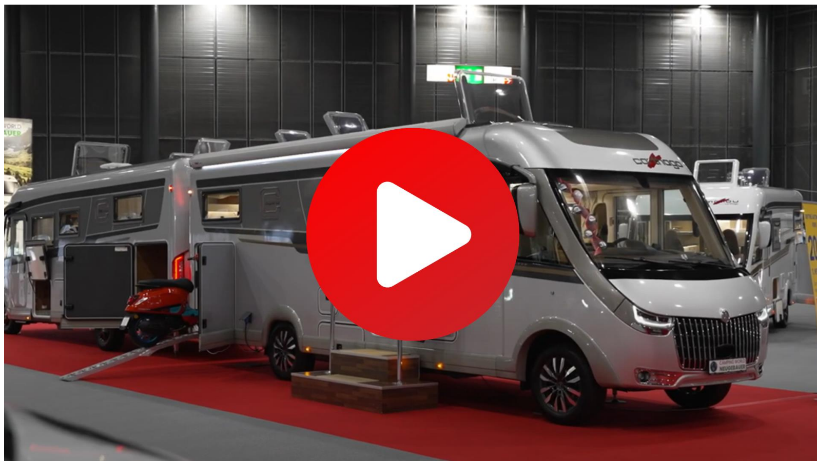
Caravaning Brno 2023