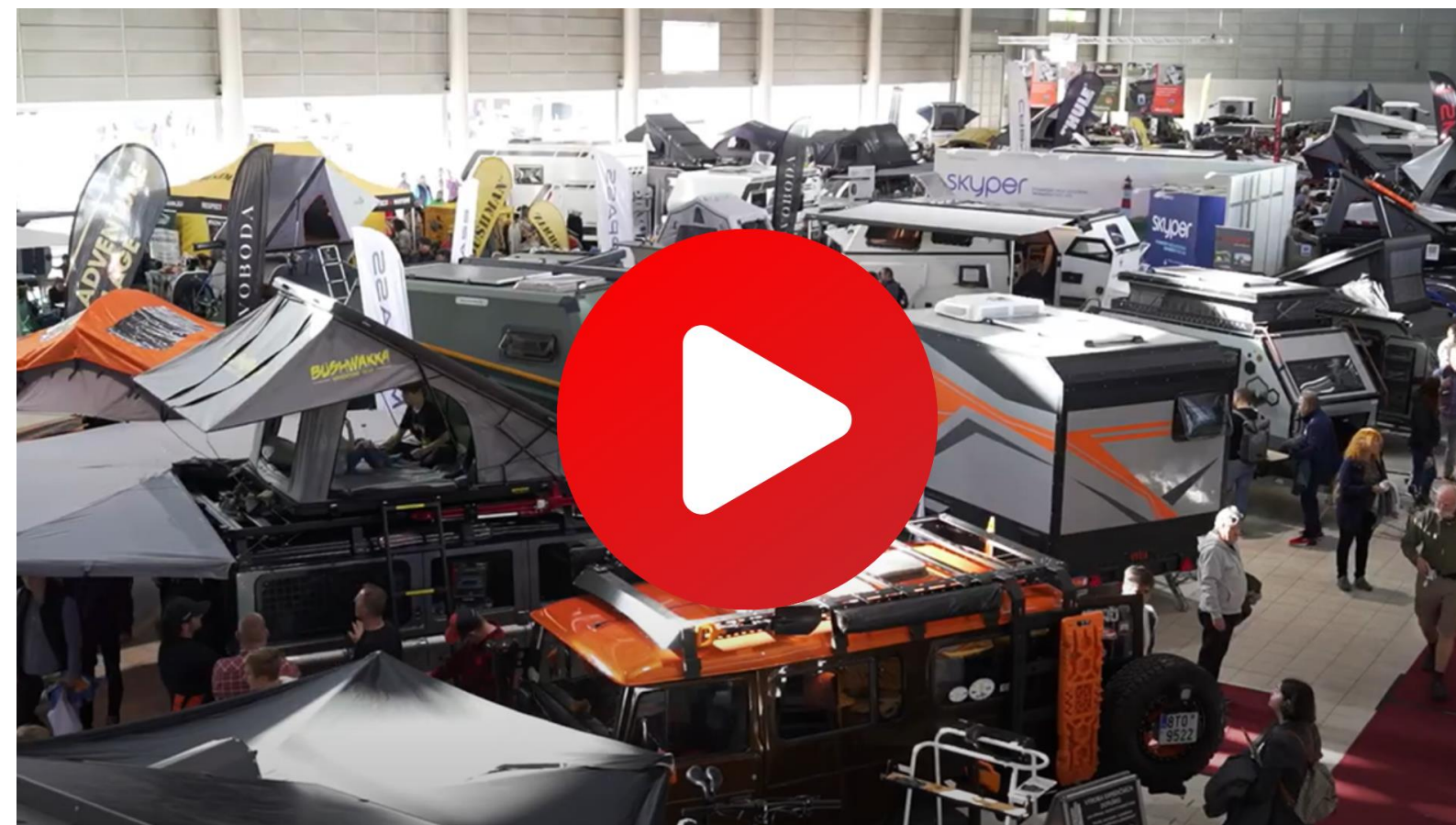
Adventure Hall na Caravaningu Brno 2023