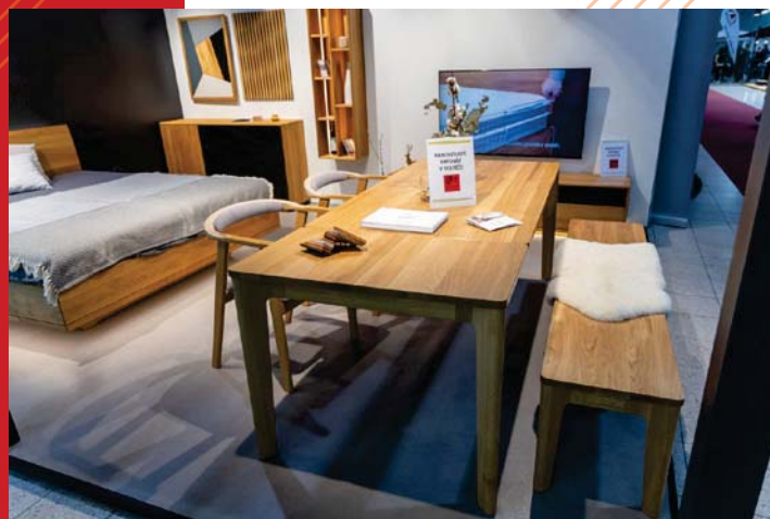
Kolekce jídelního stolu a lavice SABI